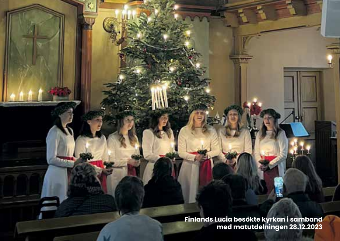
Finlands Lucia besökte kyrkan i samband med matutdelningen 28.12.2023