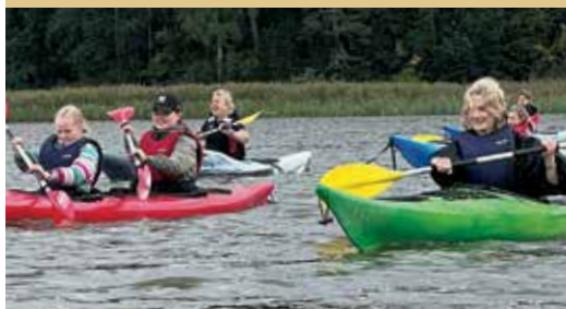
Ungdomarna fick paddla på Tjusträsket.