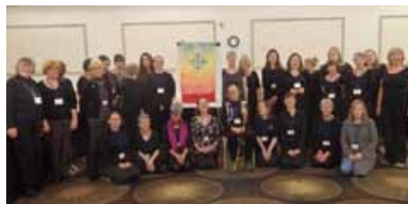
England, Wales och Nordirlands kommitté