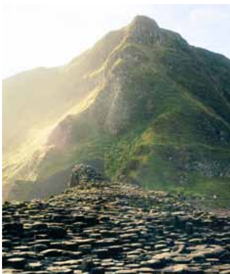
The Giant's Causeway, Nordirland