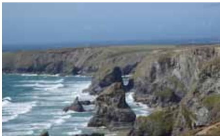
Bedruthan Steps in Cornwall, England

Låt oss gå i frid, hopp och kärlek, i Guds, vår moders och faders namn, i Sonens och den heliga Andens namn. Amen.